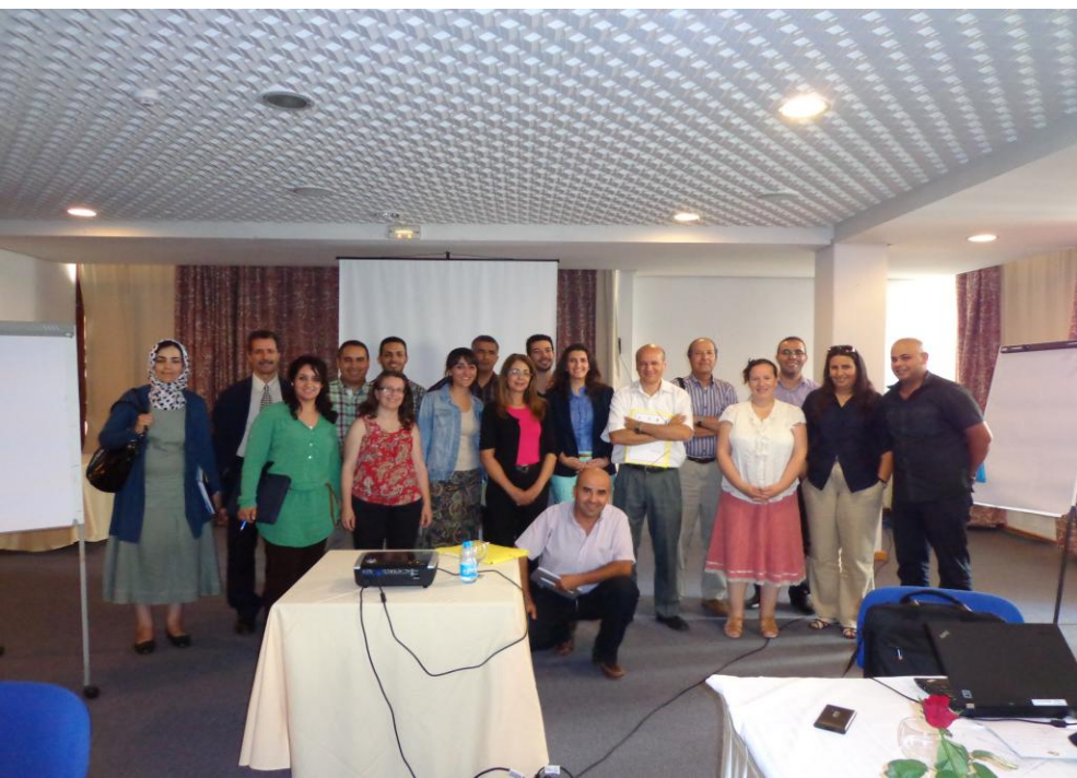
Réseau des acteurs de la Région Tanger Tétouan