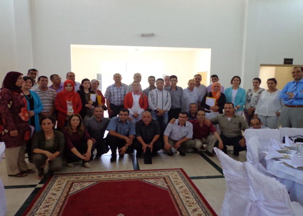
Réseau des acteurs de la Région Tadla Azilal